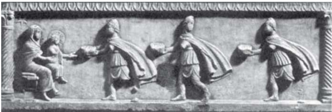
Afb. 2. Sarcofaagrelief uit Ravenna, vijfde eeuw. Ook hier de vrijwel identieke gestalten met hun Phrygische mutsen, de wapperende mantels, de korte gewaden en hier beter zichtbare lange broeken. Verschillen met afb. 1: Maria zit op de lage zetel zonder rugsteun van de Romeinse aristocratie, het kind Jesus heeft een nimbus, de ster staat achter Maria en de figuur achter haar ontbreekt. Het meest frappant: de middelste Wijze keert zich om naar de achterste: de eerste differentiatie tussen de Wijzen 9 .

Volgens een legende zou hun terugreis een jaar geduurd hebben door tegenwerking van Herodes, die hun schepen in Tarsis (Spanje!) in brand gestoken zou hebben. Eenmaal thuis zouden ze daar door de apostel Thomas, die volgens een