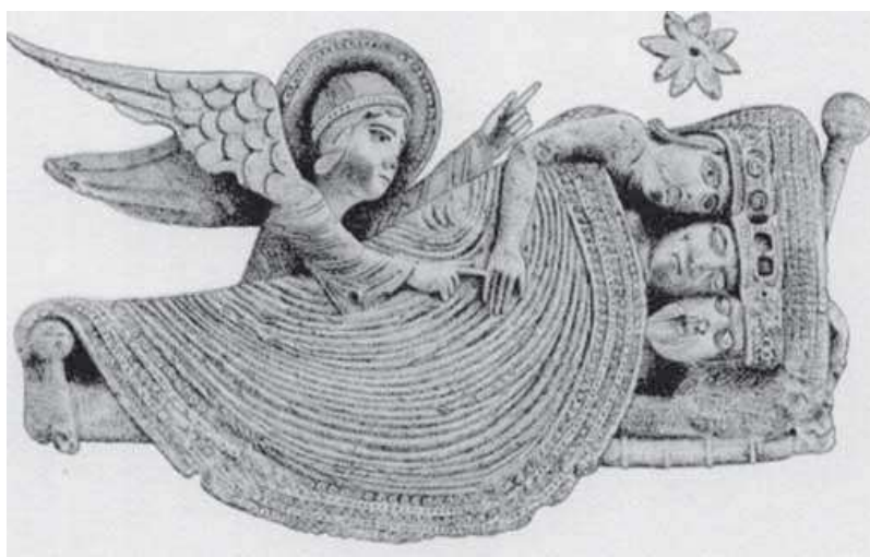
Afb. 4. De befaamde Driekoningenscène op een 12 e eeuws kapiteel te Autun, dat het wekken door de engel weergeeft: de Wijzen slapen gekroond, de onderste heeft een baard en zal de oudste zijn, de bovenste, met een snor, is wakker. De engel wijst hem op de ster.

Tegen het einde van de 4 e eeuw begint men in het oosten, eerst in Syrië en Constantinopel, de datum van 25 december over te nemen voor de geboorte. Men was overtuigd dat die datum juist was. Chrysostomos, priester te Antiochië, verklaart in 386: sinds een tiental jaren weten we pas op welke datum Christus werkelijk geboren is . In Egypte had de nieuwe datum heel wat tegenstand te overwinnen: hij werd pas ingevoerd rond 430. Jerusalem volgde toen ook, maar daar keerde men al snel weer terug naar 6 januari, om pas eind 6 e eeuw terug te gaan naar 25 december. Maar 6 januari blijft de voornaamste viering in het oosten: de epifanie , ook wel als theofanie aangeduid. Het hoofdthema blijft, behalve te Jerusalem, ook de doop van Christus 25 .