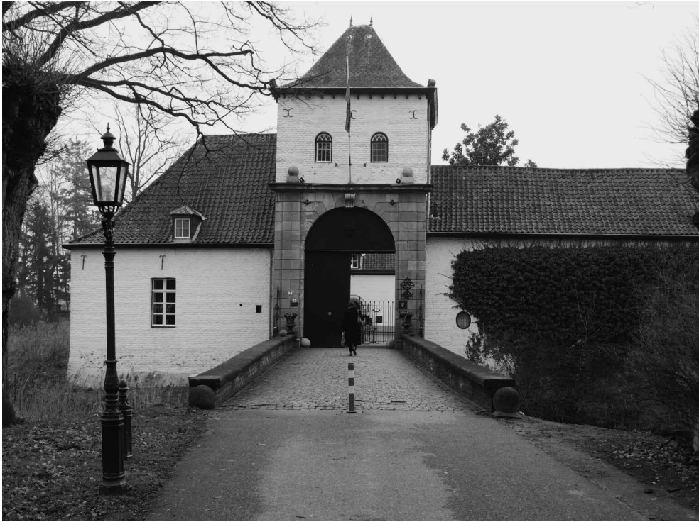
Poortgebouw kasteel Daalenbroeck