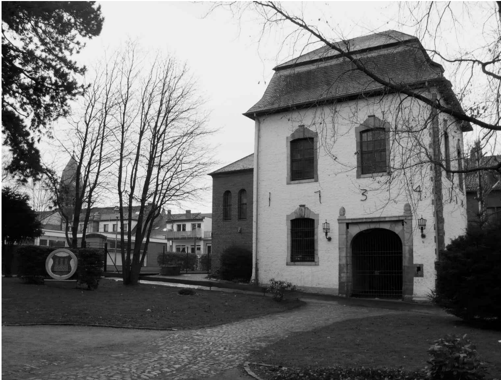
Poortgebouw van kasteel Odenkirchen.

In deze beginfase van het protestantisme moet men er overigens van uitgaan, dat de aanhangers van de hervormingsideeën bij lange na niet opteeden voor een nieuwe confessie,