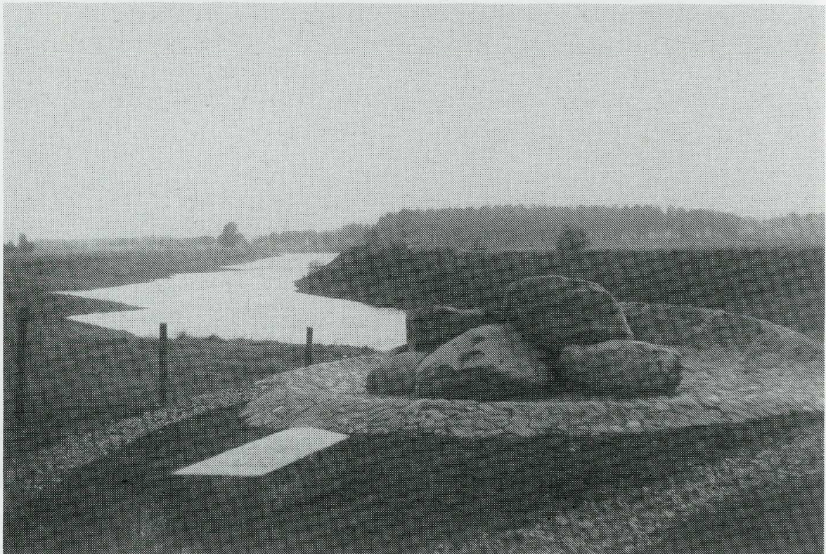
Monument van de overtocht door Willem van Oranje over de Maas in 1568.

konden niet uitblijven. De Spaanse koning Filips II stuurde op 20 juni 1567 ordetroepen onder leiding van de landvoogd Alva. De deels uitgeweken adel onder leiding van Willem van Oranje koos de weg van het geweld om Alva uit de zuidelijke Nederlanden te verdrijven. Dat resulteerde in een eerste gespreide aanval vanuit Duitsland op de Nederlandse gewesten in 1568. Daarbij raakte Karel van Bronckhorst nauw betrokken door Willem van Oranje persoonlijk hulp te bieden bij het oversteken van de Maas in de nabijheid van Obbicht in de nacht van 5 op 6 oktober 1568. Het is niet onmogelijk, dat Karel zich daadwerkelijk bij het prinselijk leger had aangesloten 38 . Net als de overige drie aanvallen bij Dalheim-Roermond op 23 april, bij Heiligerlee op 23 mei en in de Zuidelijke Nederlanden op 18 juni 1568 was de inval bij Obbicht-Stokkem uiteindelijk tot mislukken gedoemd, omdat de bevolking in de steden, Stokkem als eerste, de fakkel van de opstand niet overnam. Stelselmatig wordt de overtocht van Oranje bij Obbicht, die als één van de belangrijkste wapenfeiten uit de beginjaren van de Tachtigjarige oorlog wordt aangemerkt, in de Nederlandse geschiedschrijving over het hoofd gezien 39 .