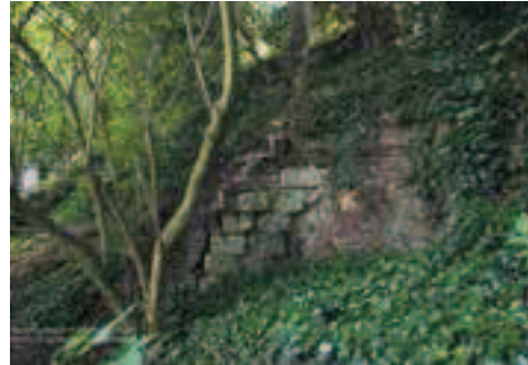
Afbeelding 7: Mergelstenen in de ommuring van de Agnetenwal, 2013.