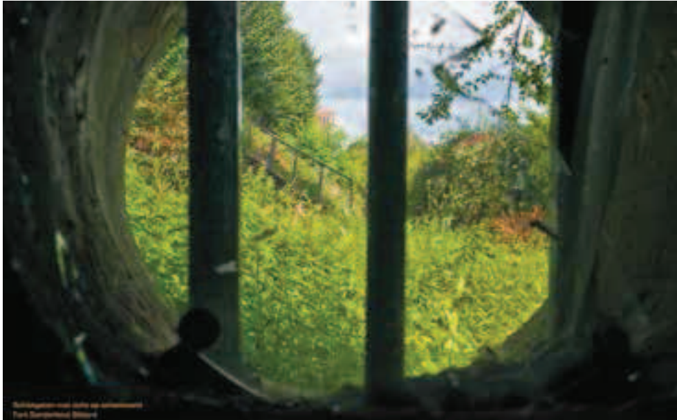
Afbeelding 13: Zicht vanuit het rechter schietgat van Fort Sanderbout.

Het is aannemelijk dat de aanaarding aan de buitenzijde heeft plaatsgevonden na de verwoestingen van de vestingwerken door de Franse troepen in april en oktober 1676. 38) In het memoireboek van de zusters Dominicanessen staat hierover geschreven dat de Franse troepen 'de stad Zittardt hadde commen demanteleren ende de geheele stadsvesten omverwerpen en de porten doen springhen'. 39) Nadat de Franse troepen Sittard ook nog grotendeels in de as hadden gelegd, betrokken twee regimenten ter sterkte van 2500 man onder leiding van de Gulikse generaal D'Avilla in september 1677 de stad. Hieraan werden nog 83 ruiters toegevoegd. Alle beschikbare mannelijke krachten van Sittard en de ambten Born en Millen werden gerekruteerd om samen met de militairen de stad weer in verdedigbare toestand te brengen. Daarnaast werden vanuit Gulik nog eens 'achtduizend' pioniers (grondwerkers) ingezet om de vestingwerken in orde te brengen. 40) De door de Fransen gecreëerde openingen in de omwalling konden door de inzet van zoveel mankracht relatief snel worden gedicht. Door verdere aanaarding aan de buitenzijde kwamen de resten van de vestingmuur in het midden van het wallichaam te liggen.