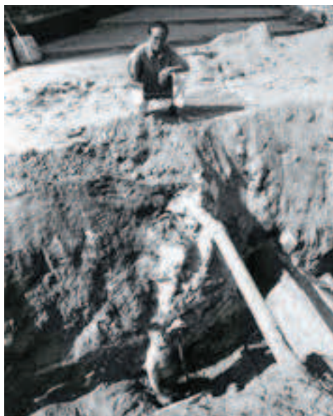
Afbeelding 3: Resten mergelstenen muur.