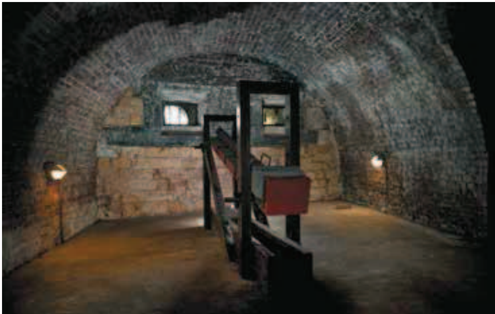
Afbeelding 12: De schietgaten aan de binnenzijde van Fort Sanderbout.