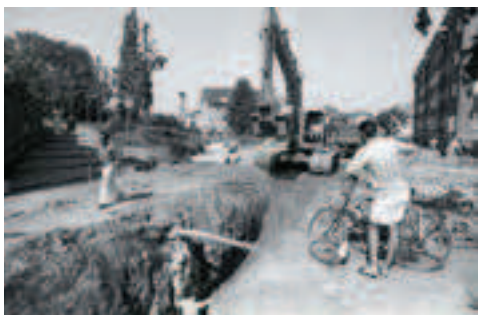
Afbeelding 2: Opgraving tussen Begijnhofwal en Dominicanenwal, mei 1992. (EHC Sittard-Geleen, coll. Roozen)

De constatering van Van Luyn dat Sittard een mergelstenen muur heeft gekend, wordt dus bevestigd door meerdere recente (archeologische) waarnemingen en niet eerder aangehaalde informatie uit archiefstukken en documentatie.