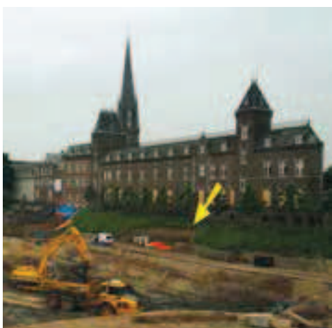
Afbeelding 4 en 5: Pijl wijst naar plek mergelstenen in de Dominicanenwal; rechts een detailopname, mei 2008. (foto's Ries van Doorn)