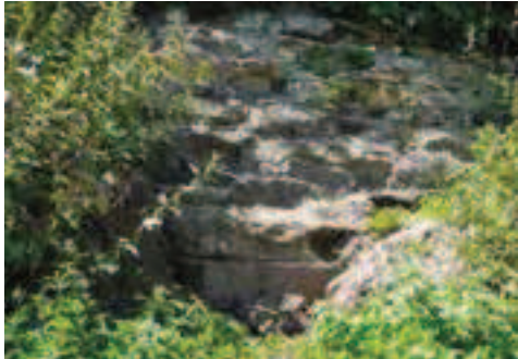
Afbeelding 6: Opname mergelstenen muur in wal Fort Sanderbout, 2008.