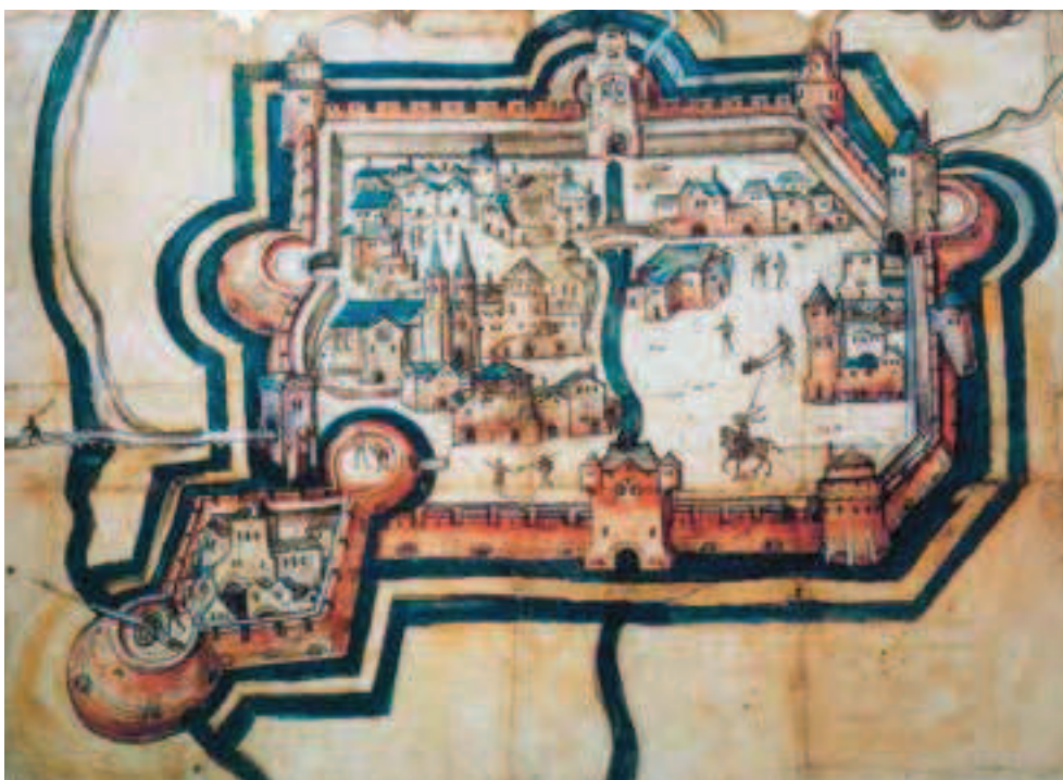
Afbeelding 1: Schets van de vesting Sittard omstreeks 1538.

Van Luyn stelde in zijn bijdrage: 'Eind 15de eeuw zijn zeker ten dele in steen uitgevoerde bolwerken gebouwd en ook torens die voor geschut aangepast waren. In 1538 zal men dan