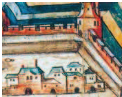
Afbeeldingen 10 en 11: Details uit schets vesting Sittard, omstreeks 1538. Aan binnenzijde aangeaarde ommuring?

plaats gevonden. De ommuring en de bolwerken zullen hierbij zeker zijn versterkt. Waarschijnlijk is bij deze versterking meer gebruik gemaakt van baksteen dan van mergel. Immers de burcht Millen die gedeeltelijk werd ontmanteld om bouw materiaal te verkrijgen voor de versterking van Sittard, was opgetrokken uit baksteen. 32) Verder is in de rekening van de rentmeester van het ambt Born over het jaar 1539-1540 aangetekend dat uit twee bossen tussen Nieuwstadt en Born geen hout werd verkocht omdat 'alles zu den ziegelsteinen und baue zo